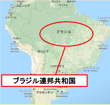
ブラジル連邦共和国

今回ご紹介する、サクラブルボンはサンタルジア農園で生産されており、バルジニアの北東部にあります。バルジニアはミナスジェライス州の南ミナスに位置し、大手輸出業者が多数集まる場所でもあります。サンタルジア農園はブルボンだけでなく、カツアイ、アカイア・ムンドノーボなども生産しており、きちんと管理されたコーヒーの中から、サクラブルボンが生み出されました。こじんまりとした農園ではありますが、農園主は社会・環境問題に責任を持って取り組んでおります。サクラブルボンは厳選した完熟ブルボンの新鮮さを保つために密封包装し20kgの箱で輸出されています。サクラブルボンは桜のように華やかでフレッシュな香りと甘みのバランスが特徴の逸品です。