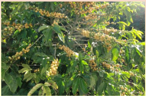
コーヒーチェリー