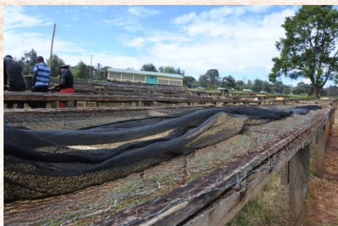
アフリカンベッド