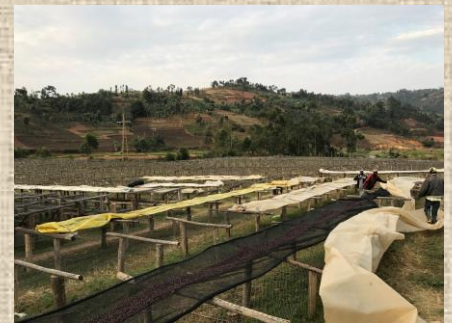
アフリカンベッド