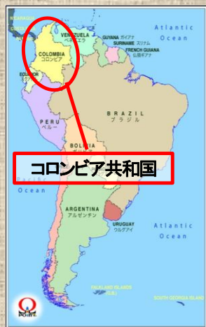
コロンビア共和国