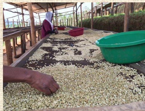
ハンドピック作業