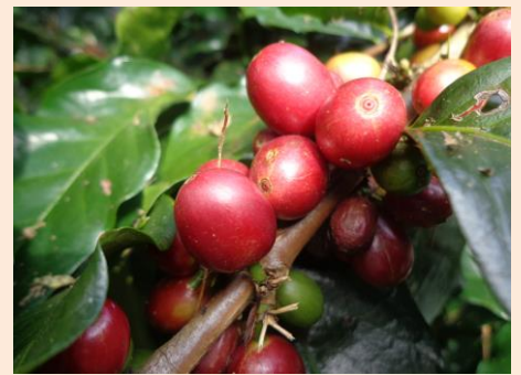
コーヒーチェリー